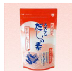
スズケン だしの薬 厳選素材で仕上げた 無添加の極上だしの薬