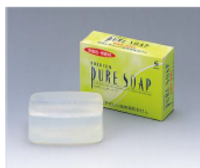
スズケン ピュアー・ソープ 無添加・無香料のお肌に やさしい高純度透明石けん