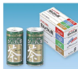
さんけん茶 無添加・無着色のヘルシー ブレンド茶