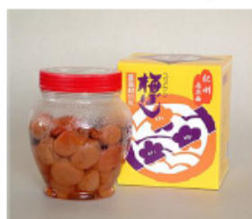
スズケン梅ぼし 塩分をおさえ、マイルド に仕上げた紀州南高梅